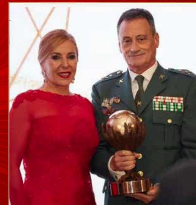
Premio Nacional 2019 Guardia Civil, por el 175 aniversario de la Fundación