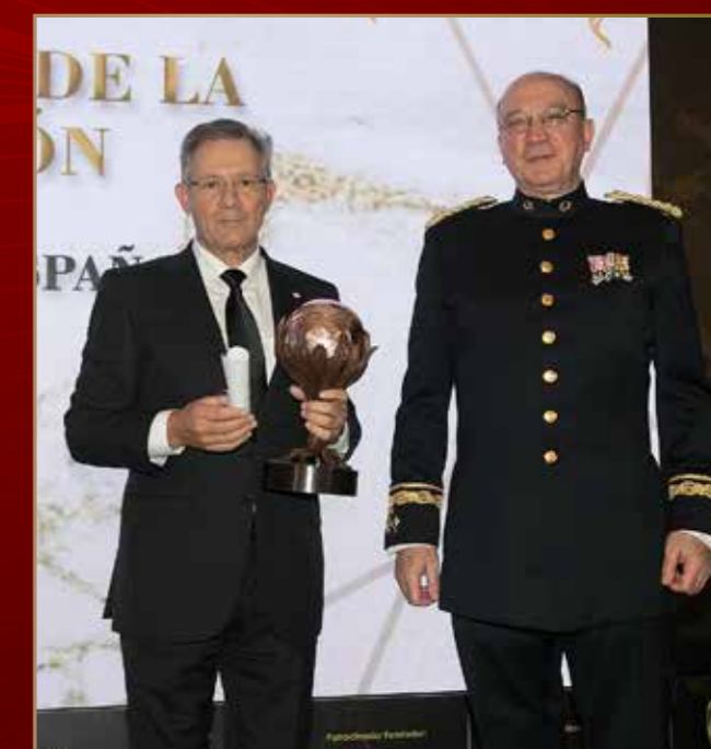
Cruz Roja Española 2019