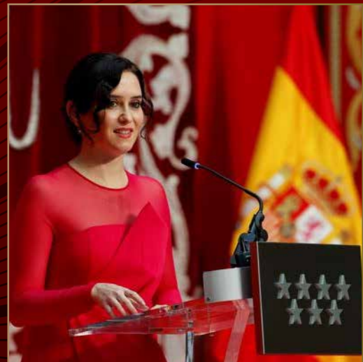
Excma. Sra. Dª Isabel Díaz Ayuso Presidenta de la Comunidad de Madrid