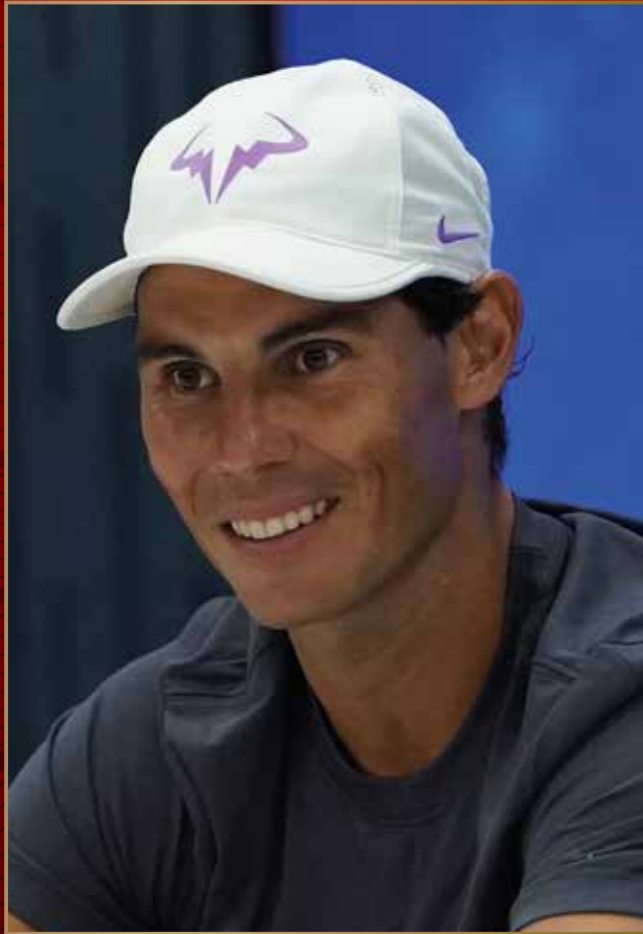
Premio Internacional 2022 D. Rafael Nadal Parera