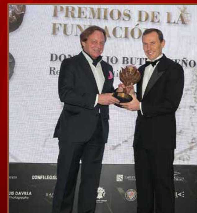
Don Emilio Butrageño 2019